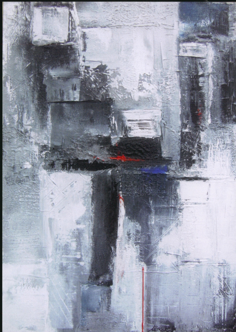
Mirko Roncelli "Io non ci sarò" acrilico su tela

Da segnalare il conferimento dell'ambito premio Leone d'oro per l'arte 2011, assegnato a Sirmione: opera premiata: "Io non ci sarò"