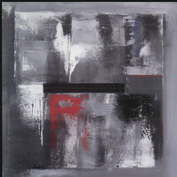
Mirko Roncelli "Tutto finisce" acrilico su tela