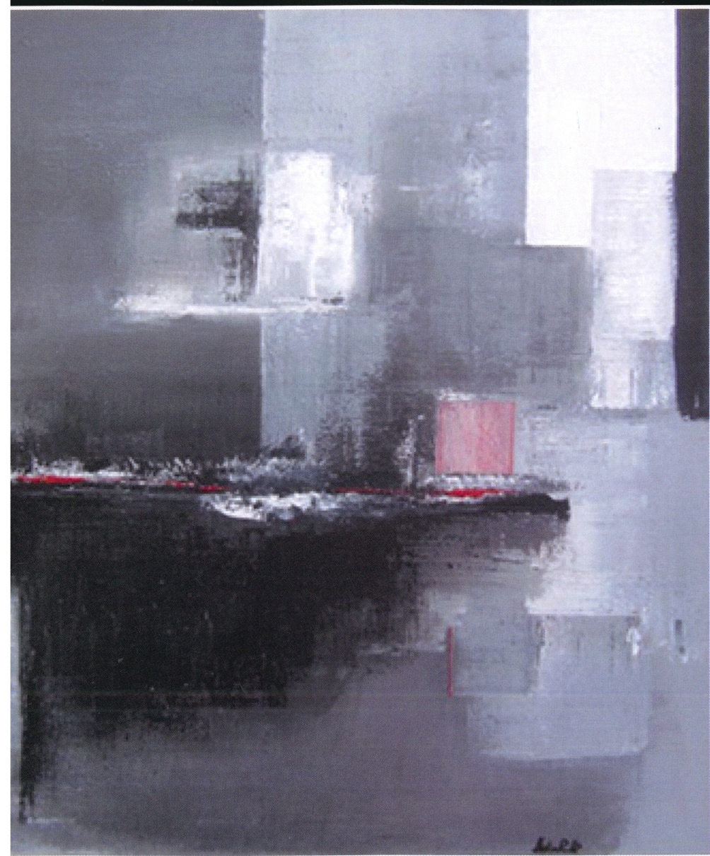
"Io non ci sarò" acrilico su tela cm 90 x 90 2009